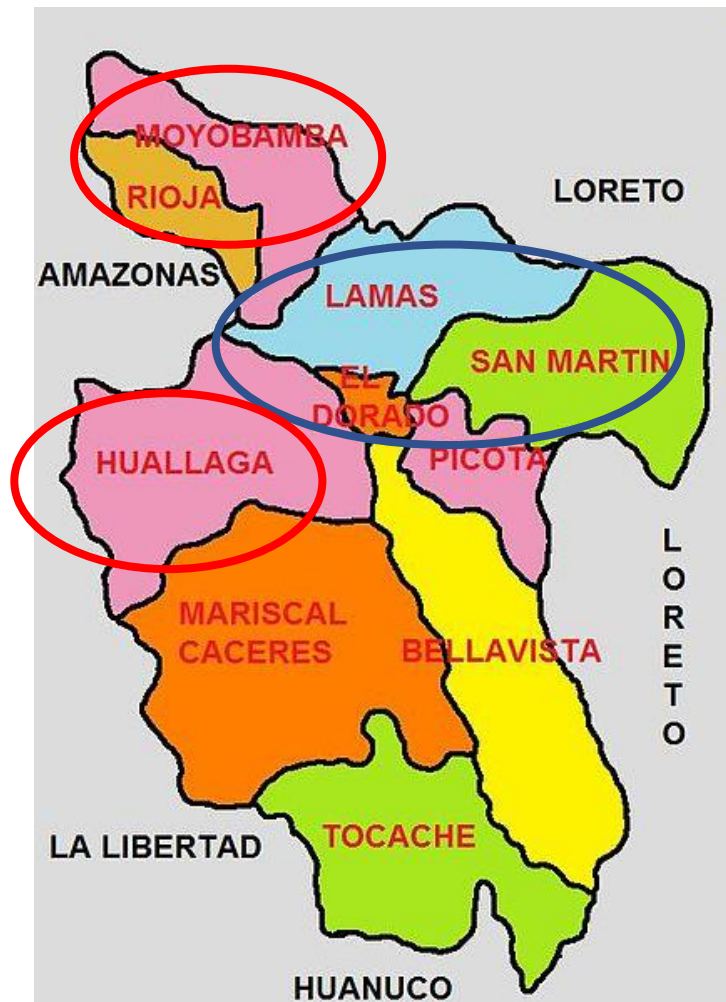
Mapa de las Provincias de la Región San Martín 2014