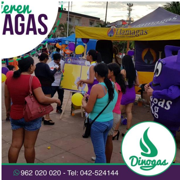
Activación en el mercado