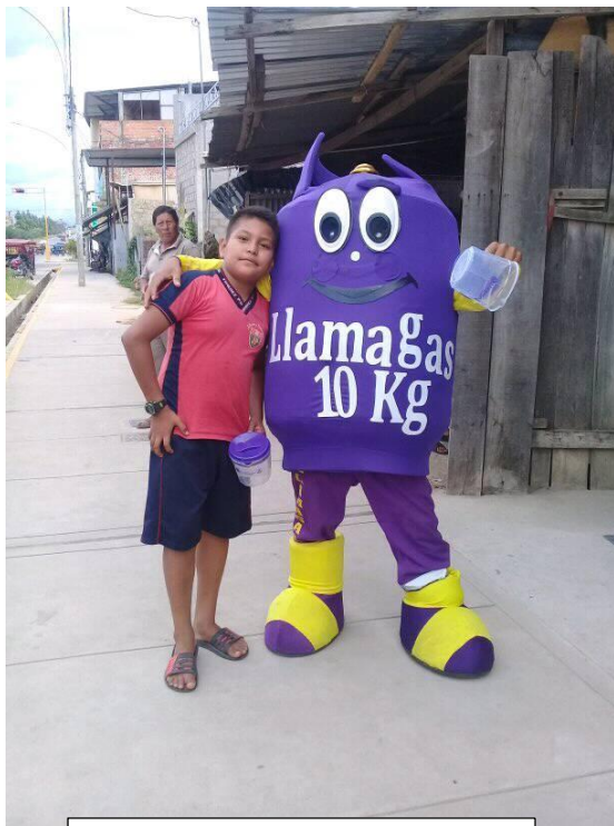
Activación de mercado