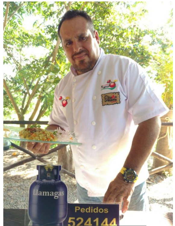
Publicidad por tv y radio