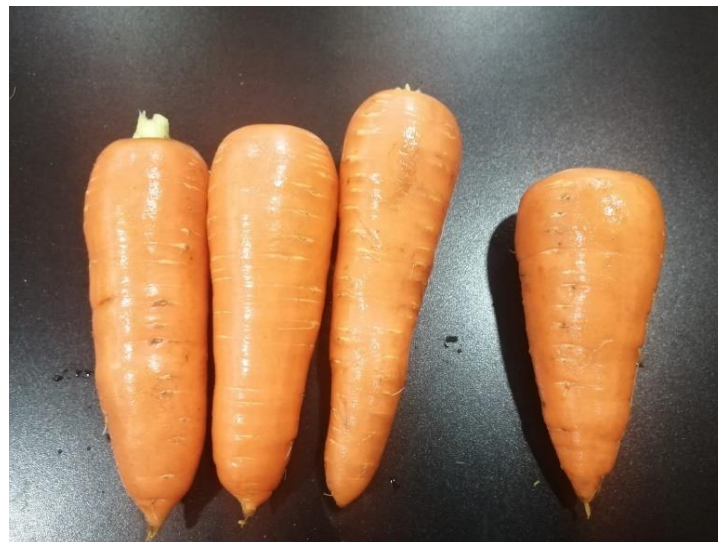
Figura 41: Calidad de zanahoria considerada tronco.

Raíces por encima y por debajo de estas medidas son consideradas descarte y no se recogen del campo.