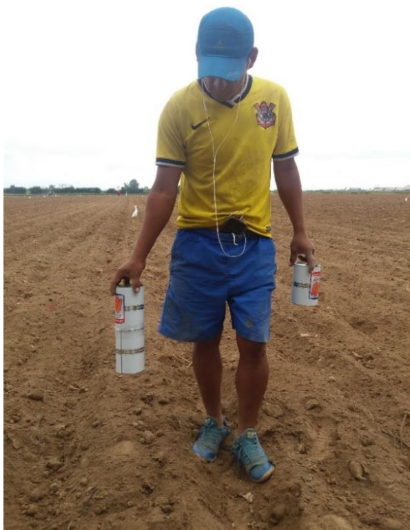
Figura 16: Siembra de zanahoria.