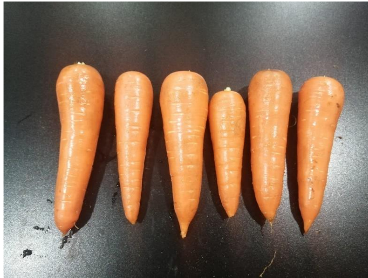
Figura 40: Calidad de zanahoria considerada segunda.