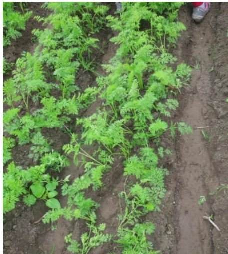
Figura 28: Campo de zanahoria desahijada.

De 1 a 2 días después del deshije se procede aplicar un paquete de productos vía foliar que contengan en su composición un bioestimulante, aminoácidos y una fuente que contenga macro y microelementos. Esta aplicación ayuda a desestresar al cultivo luego del deshije, también en este momento se aplican los fertilizantes edáficos de la segunda etapa (ver Figura 28).