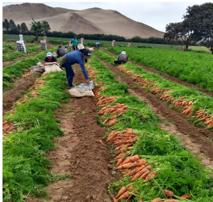
Figura 37: Cosecha y selección de zanahoria.

El personal seleccionador suelen ser mujeres ya que tienen mayor cuidado al momento de seleccionar las calidades de las zanahorias, estas suelen colocar en diferentes lados las zanahorias consideradas como primera, segunda y tronco, las raíces que no llegaron a conformarse bien son consideradas como descarte, así como aquellas raíces que puedan tener algún daño físico o por efecto de algún patógeno (ver Figura 37).