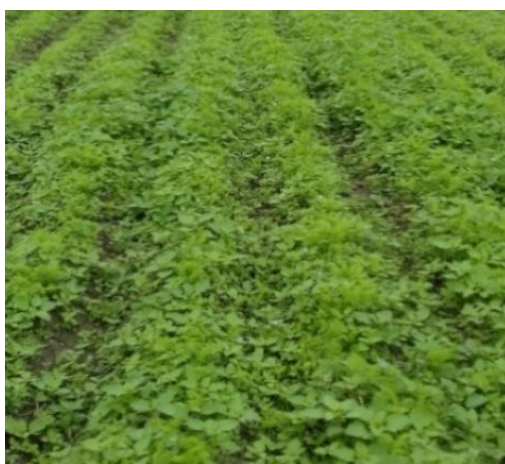
Figura 24: Momento de aplicar herbicida.

El manejo de malezas en el valle de Cañete se inicia en la preparación del terreno, en el momento que se da el riego de machaco se estimula a que las semillas de maleza germinen, estas serán eliminadas en el momento del subsolado y surcado. El segundo momento en el que se controla malezas es a los 20-25 días después de la siembra, en ese momento la zanahoria debe tener de 2 a 4 hojas verdaderas. Se realiza la aplicación de herbicidas selectivos con la finalidad que la zanahoria no sufra tanto stress, se debe considerar productos para malezas de hoja ancha y angosta, la maleza de mayor problema en los meses de temperaturas elevadas es el coquito ( Cyperus rotundus ). Se suelen utilizar los siguientes ingredientes activos; Linuron, Metribuzina, Fluazifop-p-butyl y Quizalofop-p-tefuril y las mezclas de estos. Una vez que el cultivo haya cubierto el suelo las malezas no son mayor problema, en condiciones que la densidad poblacional del cultivo es baja se recomienda realizar una segunda aplicación de herbicida y/o eliminar las malezas de forma manual (ver Figura 24).