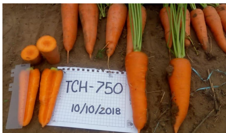
Figura 35: Zanahoria lista para ser cosechada.

Las zanahorias deben estar con humedad adecuada, esto es importante ya que permite que la raíz se mantenga con firmeza, de color naranja intenso y un brillo adecuado, que será determinante en la etapa postcosecha. Las raíces de mayor aceptación en el mercado peruano son las de formato cónicas, con hombros de 4-8 cm, con una longitud de 20-30 cm, existen ciertas cultivares híbridos que expresan una zanahoria con el final en punta roma (ver Figura 35).