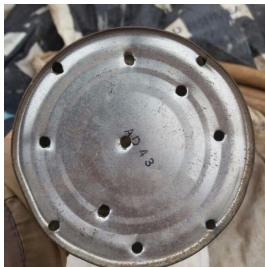
Figura 15: Orificios de sembradora.