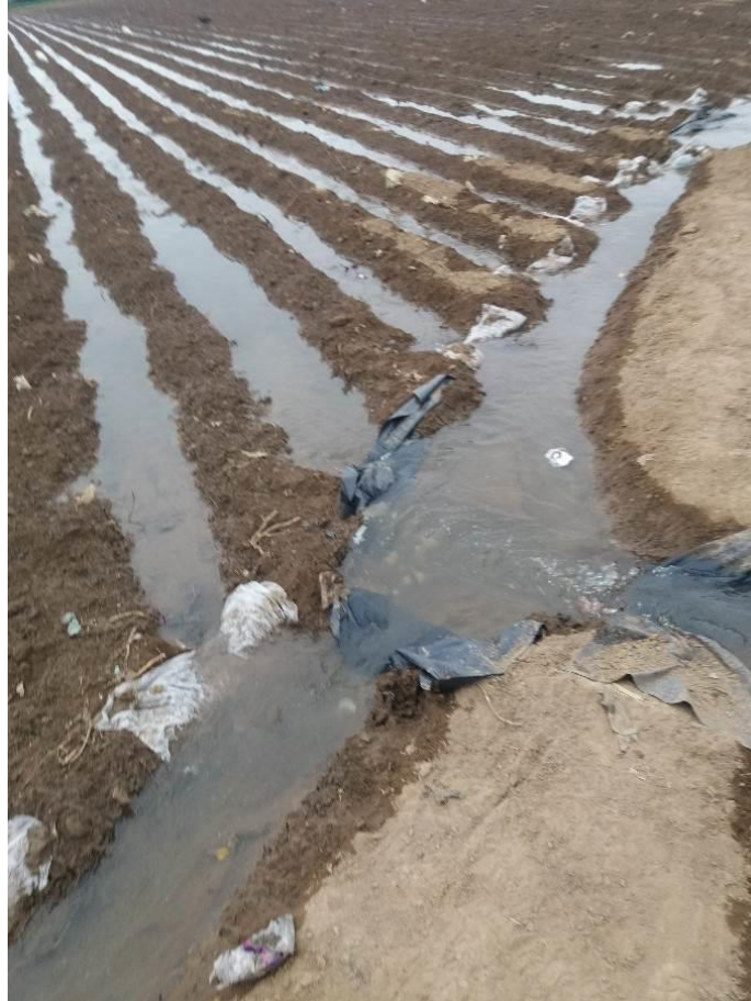
Figura 18: Tomeo del campo.