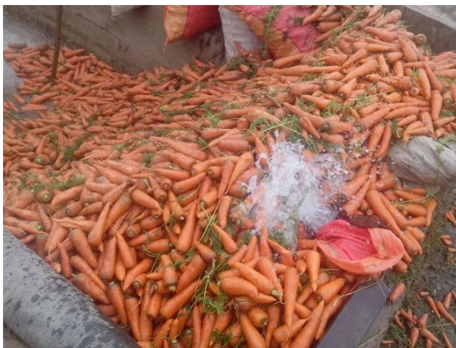
Figura 42: Zanahoria en pozas de remojo.

En el lavadero se vierten los sacos del camión hacia las pozas donde se acumula el producto, dichas estructuras se llenan con agua, se deja remojar por unos 10 minutos y se proceden a abrir las compuertas. Por gravedad el agua arrastra la zanahoria de la poza hacia la lavadora (ver Figura 42 y 43).