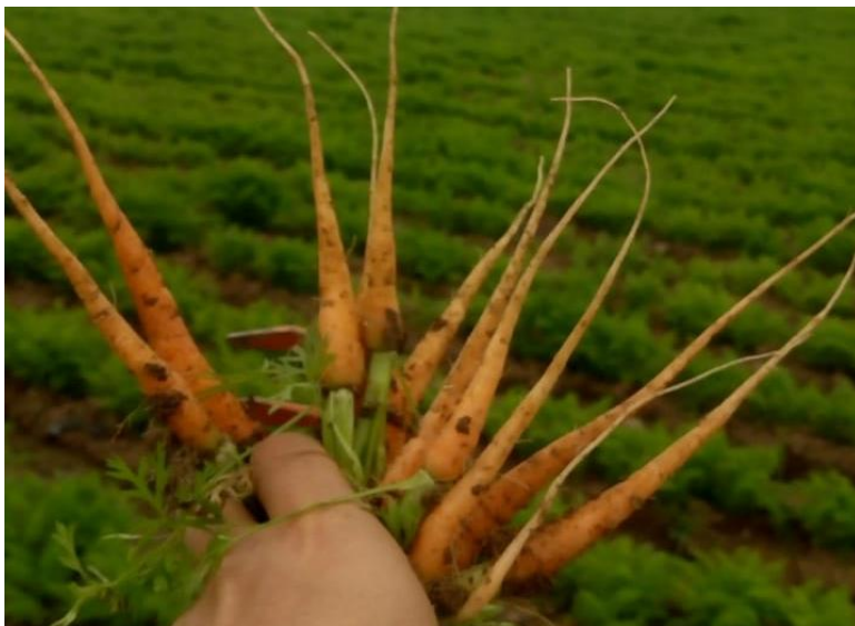
Figura 3: Raíz zanahoria tipo Chantenay.

La forma de la raíz en las distintas variedades puede ser diversa, las hay cilíndricas, cónicas, etc. (ver Figura 3). Su superficie puede ser lisa, aunque regularmente presenta rugosidades, con pequeñas hendiduras denominadas lenticelas, a través de las cuales se puede producir un intercambio gaseoso entre la raíz y el medio que la rodea (Huerres y Caraballo, 1991). También la coloración de la raíz es generalmente amarilla, anaranjada o roja. Su longitud puede variar de 15 a 18 cm., su sistema de raíces laterales, que deriva de la raíz principal, alcanza a desarrollarse entre 120 y 150 cm, extendiéndose hasta 90 cm (Valadez, 1993).