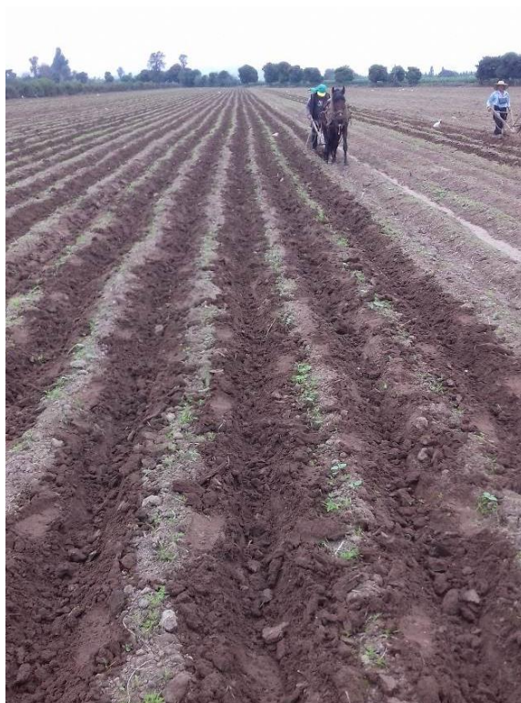
Figura 20: Cultivo de surcos.

Se recomienda dar una pasada con puntas utilizando caballo, burro o mula, antes del 3er riego. Se realiza para marcar el surco y que el agua fluya con normalidad, esto mejorará su infiltración permitiendo su difusión por todo el lomo del surco, haciendo el riego más efectivo, y consiguiendo mayor oxigenación para las raíces (ver Figura 20).