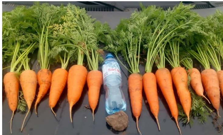
Figura 7: Engrosamiento de raíces.

Engrosamiento de la raíz: Es una fase de producción y acumulación de carbohidratos y acumulación de agua, con agrandamiento celular. La extensión en diámetro (engrosamiento) de la raíz comienza lentamente, se acelera posteriormente para atender finalmente el máximo estado de grosor. El crecimiento no cesa, ya que si las hojas permanecen presentes la raíz continúa engrosando. El aumento de tamaño comienza por la parte alta de la raíz y culmina por la punta; en aquellas variedades de punta redondeada, el agrandamiento de la extremidad se da en las últimas semanas antes de la cosecha. (ver Figura 7).