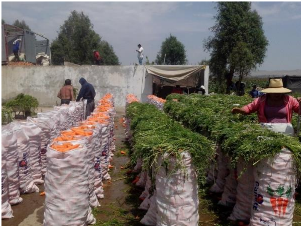
Figura 45: Ensacado final del producto.

Acabado el tiempo se abre una compuerta dosificadora que permitirá que llenemos los sacos de 65 kilogramos. Los sacos son de material de polietileno de color blanco. Una vez llenos son tapados con hojas de zanahoria y se proceden a cocer con aguja y pabilo (ver Figura 45).