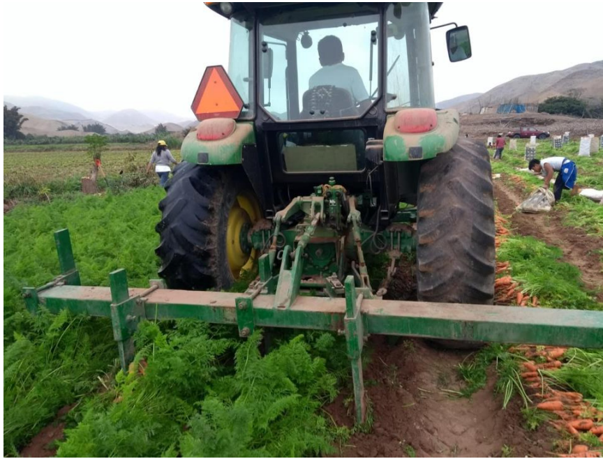
Figura 36: Remoción de suelo.

El personal seleccionador suelen ser mujeres ya que tienen mayor cuidado al momento de seleccionar las calidades de las zanahorias, estas suelen colocar en diferentes lados las zanahorias consideradas como primera, segunda y tronco, las raíces que no llegaron a conformarse bien son consideradas como descarte, así como aquellas raíces que puedan tener algún daño físico o por efecto de algún patógeno (ver Figura 37).