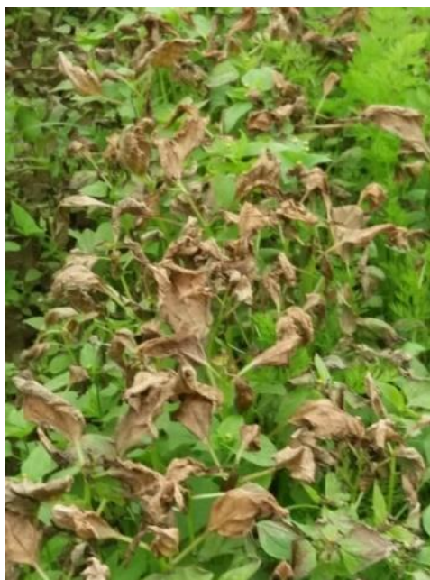
Figura 27: Efecto del herbicida en malezas.

Aproximadamente entre los días 25 y 28 se debe aplicar un paquete nutricional para recuperar el cultivo del stress causado por la aplicación de herbicidas, se recomienda aplicar un bioestimulante, algas marinas y alguna fuente que contenga nitrógeno, fosforo, potasio y microelementos (ver Figura27).