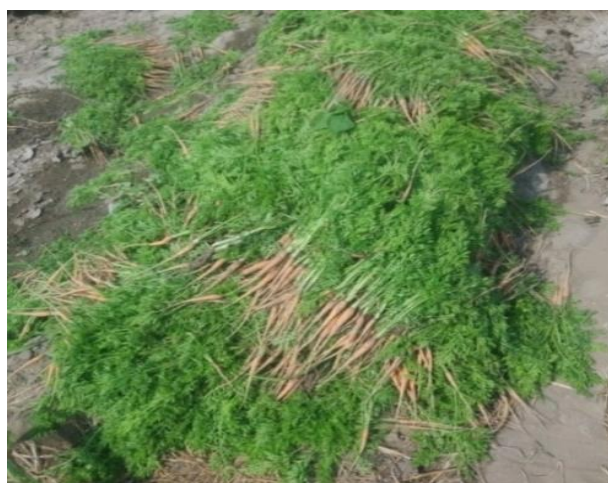
Figura 23: Zanahoria deshojada.