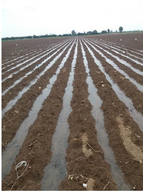
Figura 19: Riego de germinación.

El segundo riego se da aproximadamente a los 12 días después de la siembra, la finalidad es estimular enraizamiento para un rápido establecimiento. Se recomienda dar un riego corto de 2 a 4 horas. El tercer riego se da cerca de los 17 días después de la siembra, se recomienda dar este riego para estimular que las malezas germinen y desarrollen, ya que a los pocos días se realiza la aplicación de herbicida. Se recomienda dar un riego corto.