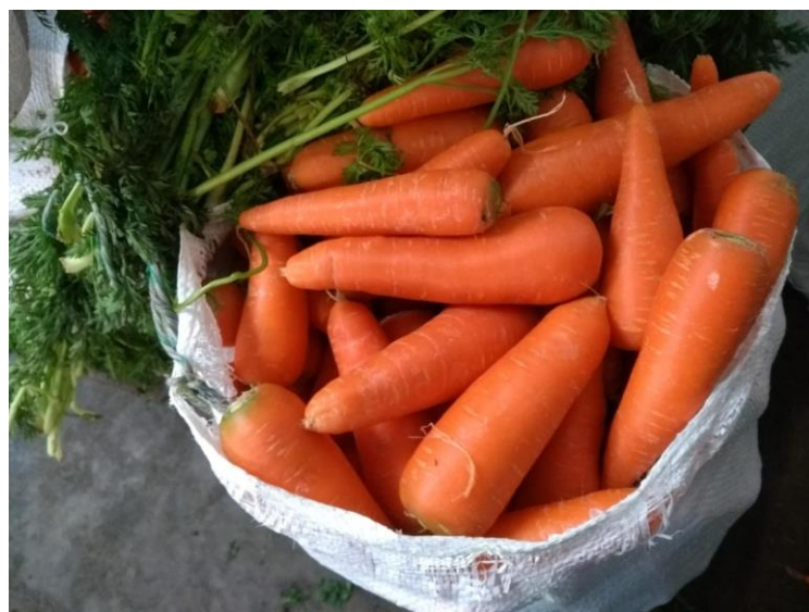
Figura 39: Calidad de zanahoria considerada primera.