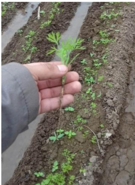
Figura 26: Cultivo de zanahoria con 2 a 3 hojas verdaderas.