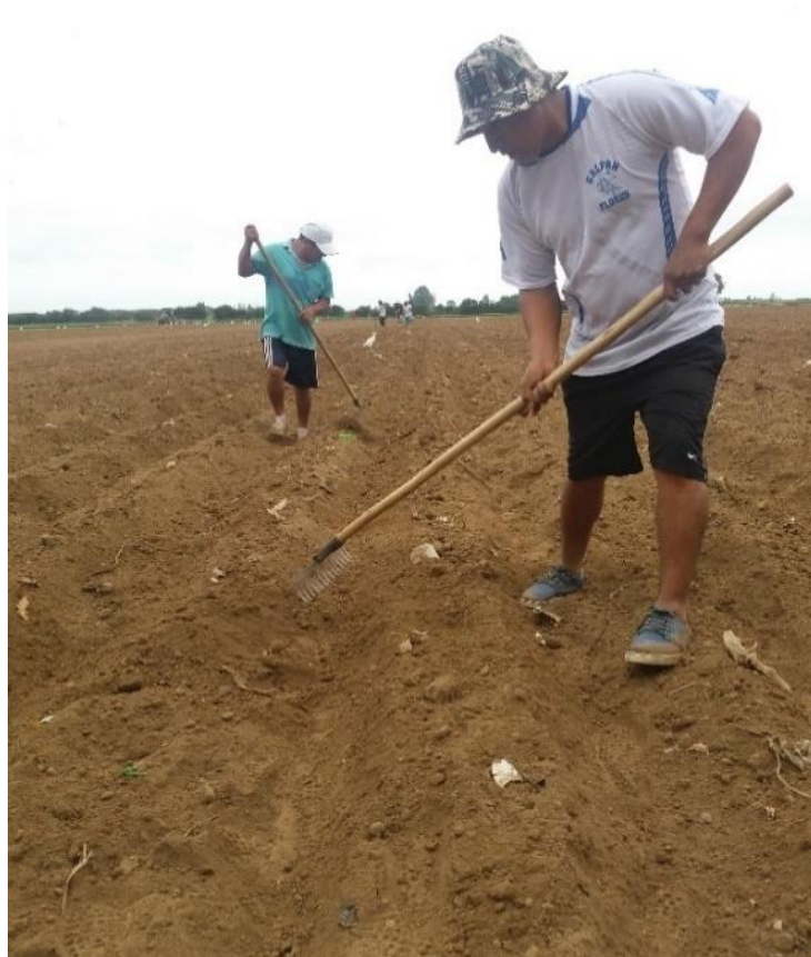
Figura 17: Tapado de semilla

El procedimiento de siembra en Cañete no es tan eficiente ya que la semilla al salir de la lata sembradora y caer al suelo puede ser arrastrada por el viento, así mismo esta puede caer en la costilla, así como en el fondo de surco. También se da el caso en el que el paso del sembrador es muy rápido o lento generando desuniformidad a lo largo del lomo. De igual manera el personal que realiza la labor de tapado muchas veces tapa con demasiada tierra dificultando la germinación y emergencia. De igual manera ocurre con el otro escenario al tapar con poca tierra, esto genera que el lomo se deseque con mayor rapidez generando mortandad de individuos.