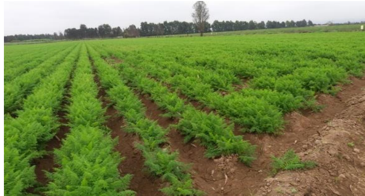
Figura 30: Cultivo de zanahoria a los 50 días después de la siembra.

Aproximadamente a los 10 días de la aplicación anterior se recomienda repetir paquete anterior. Esta aplicación favorece a la formación de nueva masa foliar contribuyendo al almacenamiento de sustancias de reserva en hojas. Se considera la segunda aplicación de desarrollo (ver Figura 30).