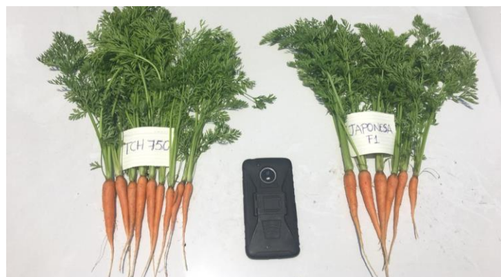
Figura 29: Cultivo de zanahoria a los 40 días después de la siembra.

Aproximadamente 1 semana después del deshije se recomienda realizar una aplicación foliar, este paquete incentivo a la planta a desarrollar la raíz pivotante y cabellera radicular, así como contribuir al inicio del almacenamiento de nutrientes en los órganos de reserva, es considerada también como la primera aplicación foliar de desarrollo (ver Figura 29). Generalmente esta aplicación está constituida de productos a base de; aminoácidos, bioestimulante, calcio, zinc y boro.