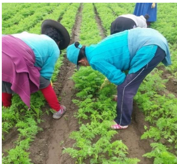
Figura 22: Deseho de zanahoria.

Dentro de la quinta semana se debe realizar la práctica de deshije, en Cañete existen cuadrillas especializadas en esta labor, generalmente están constituidas de mujeres. La práctica consiste en eliminar plantas del campo dejando una población de aproximadamente 750000 individuos, se debe procurar que las plantas que queden en campo sean uniformes y de buen vigor. Hay que considerar que esta labor se lleve a cabo cuando el suelo este con una humedad adecuada que permita caminar al personal por el campo y poder realizar una práctica eficaz. Se debe dejar un espacio entre 2 a 3 cm entre plantas para que el crecimiento de la zanahoria sea uniforme y proporcional en relación con el largo de la raíz y hombros. Posterior a ello se debe reunir y retirar las plantas deshijadas (ver Figura 22, 23).