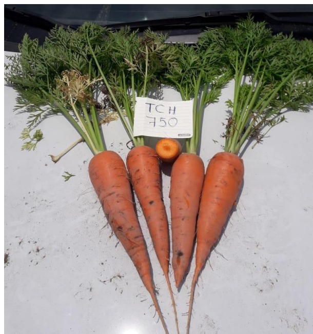
Figura 33: Cultivo de zanahoria a los 80 días después de la siembra.

Aproximadamente a los 80 días se realiza la tercera y última aplicación de llenado. Se realiza de 20 a 30 días antes de la cosecha (ver Figura 33).