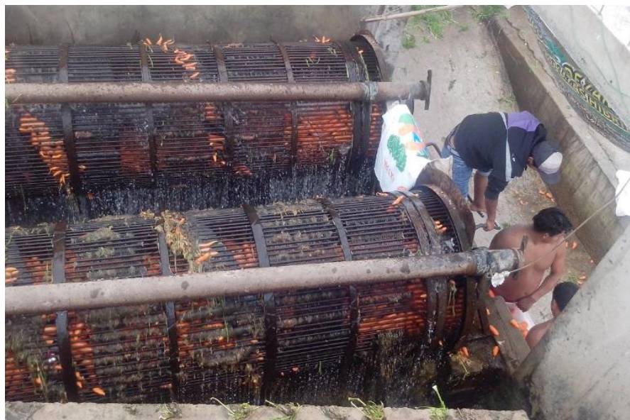
Figura 44: Lavado de zanahoria en lavadora artesanal.

El lavado de la zanahoria es la etapa final del proceso de producción, por costumbre el productor tiene al producto por 10 a 15 minutos en la lavadora (ver Figura 44). En este tiempo se eliminan restos de hojas, tierra y sobre todo una capa cerosa que da una apariencia blanquecina en la postcosecha.