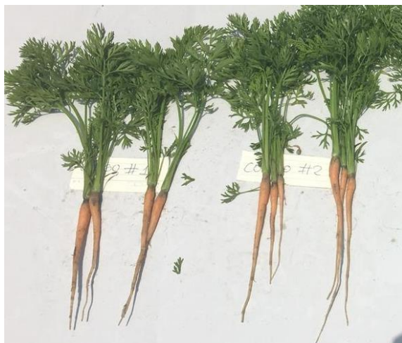
Figura 6. Período de desarrollo de raíces absorbentes.

Desarrollo de raíces absorbentes y hojas: Es una fase de producción y utilización de carbohidratos, en proporción se da mayormente el crecimiento en largo de raíz. Este alargamiento se produce principalmente en la primera mitad del ciclo, presentando al final de este período, el 80 % de la longitud medida a la cosecha. Es una etapa de activa división celular. (ver Figura 6).