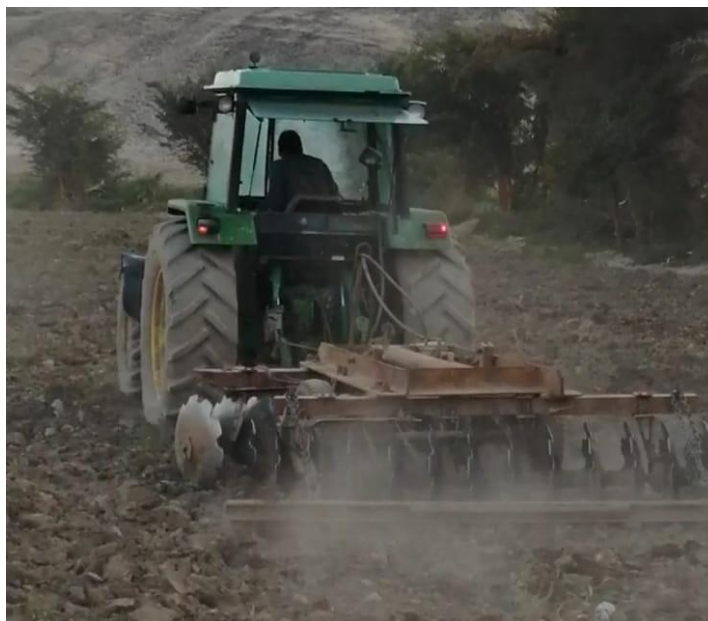
Figura 13: Preparación del terreno.

La nivelación consiste en pasar sobre el suelo una barra metálica con el fin de nivelar el suelo para que este quede listo para la siembra. Hay que considerar la humedad del suelo, para prevenir daños por compactación y por erosión (ver Figura 13)