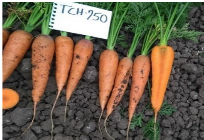
Figura 32: Raíces de zanahoria a los 70 días después de la siembra.

Unos 10 días después de la aplicación anterior se procede a realizar la segunda aplicación de llenado. Se debe repetir la dosis anterior. A esta edad es importante que el suelo este con una humedad adecuada para un llenado de raíz uniforme (ver Figura 32).