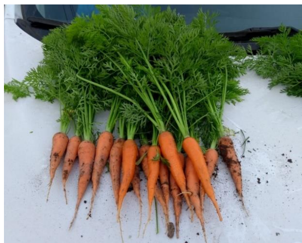
Figura 31: Cultivo de zanahoria inicio de llenado de raíces.

10 días después de la última aplicación de desarrollo, se recomienda realizar una aplicación a base de aminoácidos, bioestimulante y potasio. Se considera la primera aplicación de llenado de la raíz que va a tener 3 repeticiones. De este punto en adelante la raíz empieza a engrosar y es importante activar el transporte de nutrientes de las hojas adultas hacia las raíces (ver Figura 31).