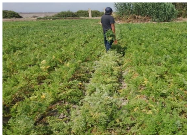
Figura 11: Ataque de Oidium.

Se caracteriza por la formación de una cenicilla de color blanquecina, se recomienda tratarlos con activos de Clorotalonil, Mancozeb. (ver Figura 11)