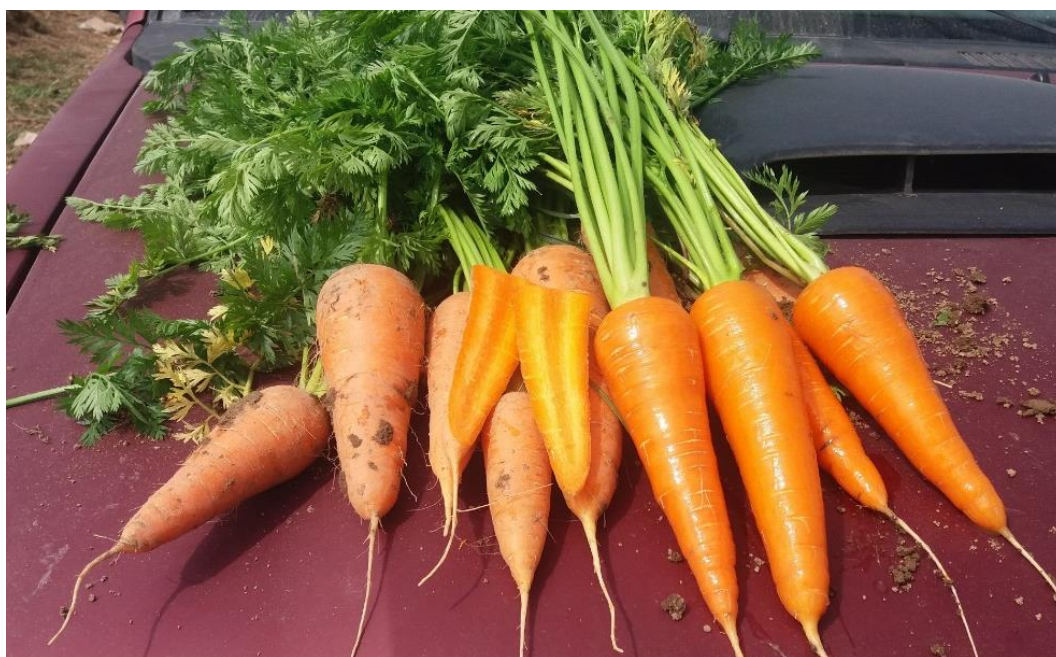
Figura 34: Muestreo de zanahoria para ser cosechada.

Días antes de la fecha tentativa a la cosecha se debe muestrear el lote para determinar el lugar por donde iniciar dicha labor, así mismo se evalúa si el terreno está con la humedad adecuada para el ingreso de la máquina (ver Figura 34).