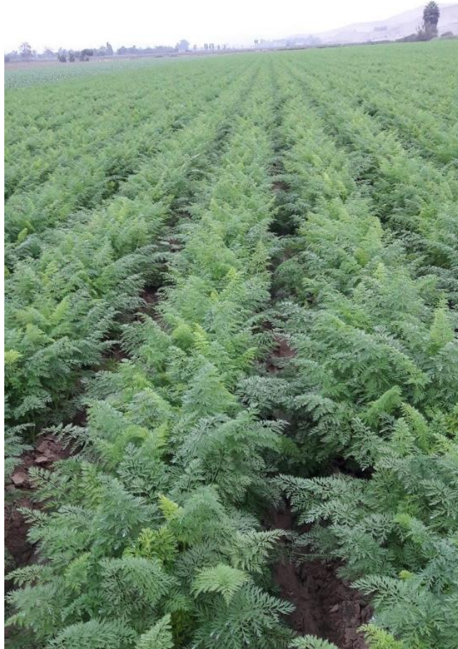
Figura 21: Momento de tercer cultivo.

Se recomienda realizar una última pasada con puntas ahondando el fondo del surco y marcando el cauce del agua del 6to riego, esta práctica mejorara la infiltración del agua y aireación del suelo. Esta labor cultural en esta etapa estimula al cultivo a prepararse para iniciar el llenado de la raíz (ver Figura 21).