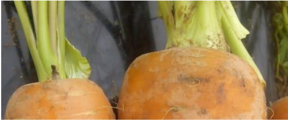
Figura 2: Tallo de zanahoria tipo Chantenay.

El tallo (Ver Figura 2) es muy rudimentario y está reducido a un pequeño disco o corona en la parte superior de la raíz, con una longitud de 1.0 a 2.5 cm (Vigliola, 1992).