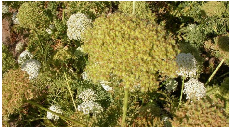
Figura 4: Inflorescencia de zanahoria.

La inflorescencia es una umbela compuesta subglobosa, formada por umbelas primarias y secundarias, las flores siempre son blancas, menos las centrales de cada umbela, que son de color rosado o púrpura, siendo a veces todas coloreadas (ver Figura 4). Cada flor está compuesta por cinco pétalos y cinco estambres; son hermafroditas, pero algunas veces puede haber flores femeninas y masculinas (Valadez, 1993).