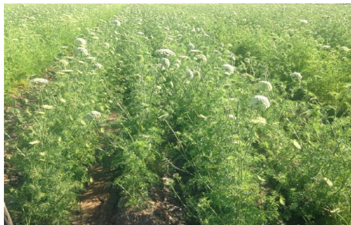
Figura 8: Fase reproductiva.

La fase reproductiva comprende la producción de flores, frutos y semillas. La zanahoria es inducida a la floración cuando existe una acumulación de horas de frío, de temperaturas inferiores a 10 °C. Luego de la inducción, la manifestación de la floración, alargamiento del tallo floral, se produce a principios de primavera con el alargamiento de los días y el aumento de la temperatura (ver Figura 8).