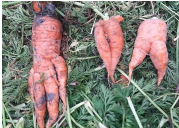
Figura 10: Ataque de nemátodos.

etc.). Otro género importante dentro de los nemátodos que ataca la zanahoria es Pratylenchus spp.