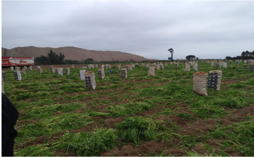
Figura 38: Ensacado de raíces de zanahoria.

Las zanahorias se ensacarán según calidad, y luego se suben al camión para ser llevados al lavadero donde se lavará y ensacará para ser comercializados en el mercado (ver Figura 38).