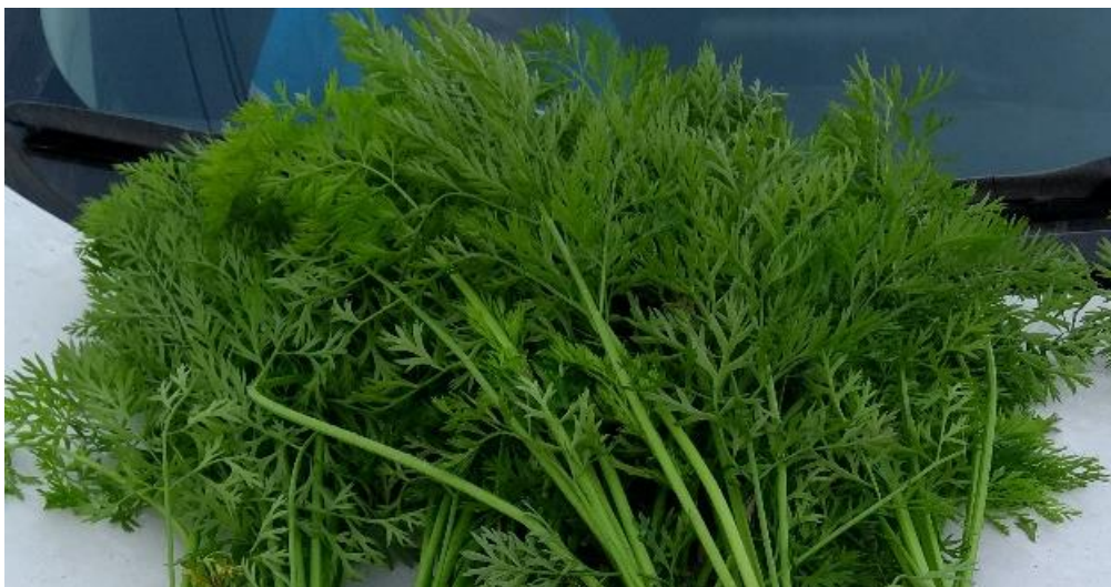
Figura 1: Peciolo y hojas de zanahoria tipo Chantenay

Las hojas de la zanahoria (ver Figura 1) son compuestas, con folíolos marcadamente hendidos y en algunos casos poseen vellos. De acuerdo con las distintas variedades, los pecíolos pueden ser más o menos largos y el color de las hojas puede variar de verde claro a oscuro (Huerres y Caraballo, 1991).