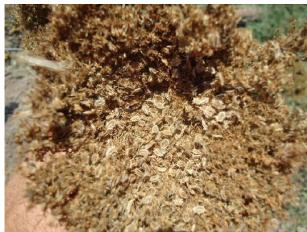
Figura 5: Frutos y semillas de zanahoria.

El fruto es un diaquenio y las semillas son pequeñas (3 mm) (ver Figura 5), elípticas, de color café claro (Valadez, 1993) y con dos caras asimétricas, una plana y otra convexa, provista en sus extremos de unos agujones curvados (Maroto, 1995).