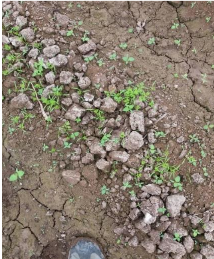
Figura 25: Emergencia de plántulas de zanahoria.

Apenas haya germinado un 70% de población, aproximadamente a los 10 días se suele realizar una aplicación nutricional a base de un bioestimulante orgánico, generalmente complementando a la primera aplicación sanitaria. La finalidad de esta aplicación es hacer más eficiente la aplicación sanitaria y estimular el desarrollo de las plántulas (ver Figura 25).