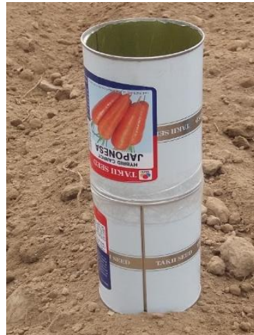
Figura 14: Sembradora artesanal.

Elaboración de una sembradora: Se va a preparar una sembradora que consta básicamente de 2 envases de zanahoria que serán unidos uno por la parte superior y otra por la parte inferior. Aquella lata que se ubica en la parte superior deberá ser cortada quitándole la base y la tapa, en la otra lata solo se deberá quitar la tapa, para unir ambas latas fijar con la cinta de embalaje, obteniendo un cilindro de aproximadamente 40 cm de alto. Finalmente se debe perforar la base de la sembradora utilizando un clavo y un martillo, se realizarán pequeños huecos entre 0.3 a 0.5 cm de diámetro por donde saldrán las semillas. Se recomienda preparar unas 6 sembradoras (ver Figura 14, 15).