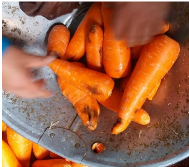
Figura 12: Manchas radiculares.

Enfermedad más problemática del cultivo, afecta la raíz con pequeñas manchas elípticas, las manchas se tornan de un color marrón claro provocando pudrición del área afectada. Se recomienda tener un buen drenaje, rotación de cultivos, tratarlos con el activo Metalaxil (ver Figura 12).