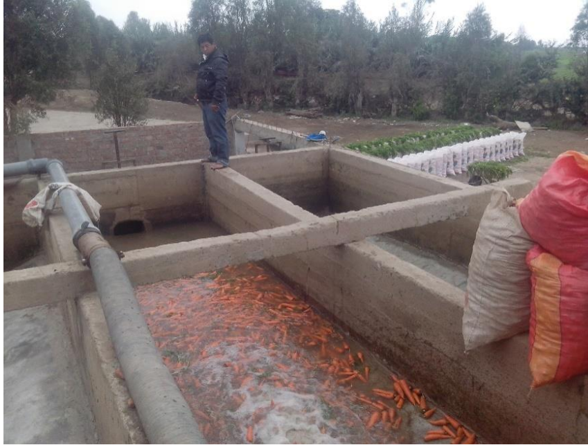
Figura 43: Remojo de zanahoria previo al lavado.

El lavado de la zanahoria es la etapa final del proceso de producción, por costumbre el productor tiene al producto por 10 a 15 minutos en la lavadora (ver Figura 44). En este tiempo se eliminan restos de hojas, tierra y sobre todo una capa cerosa que da una apariencia blanquecina en la postcosecha.