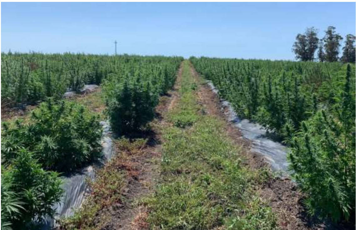
Figura 5. Plantación de Cannabis medicinal en Uruguay con inflorescencias maduras y con alto contenido de CBD.