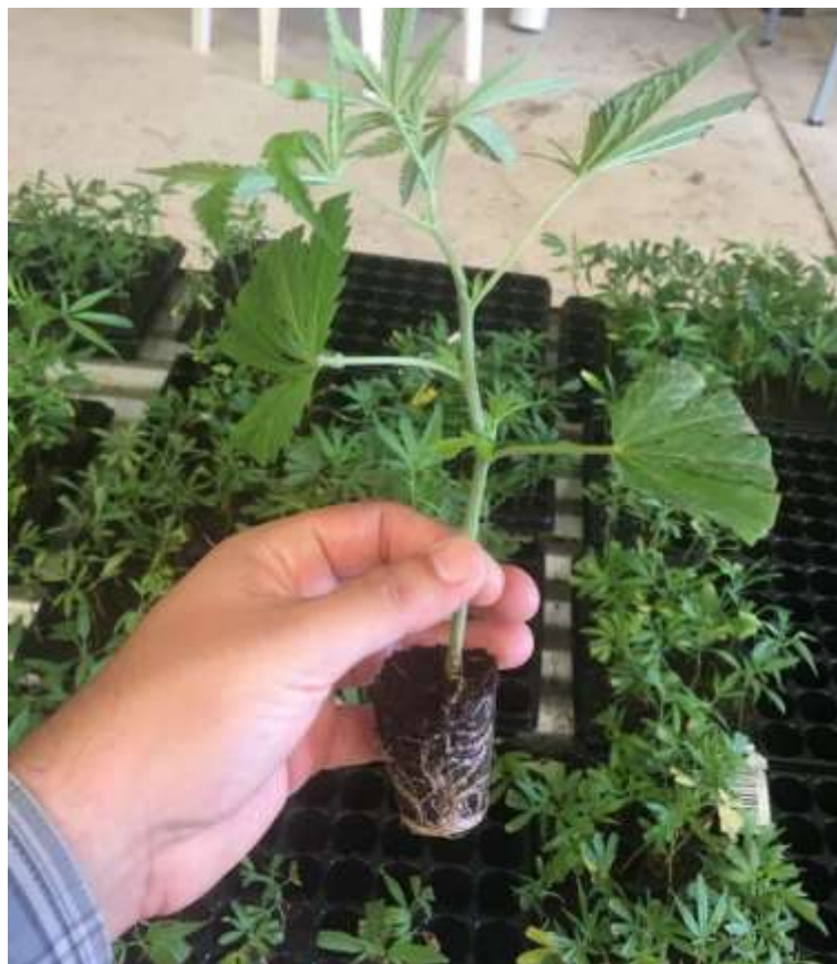
Figura 8. Plantín de Cannabis a partir de esqueje con raíces desarrolladas.