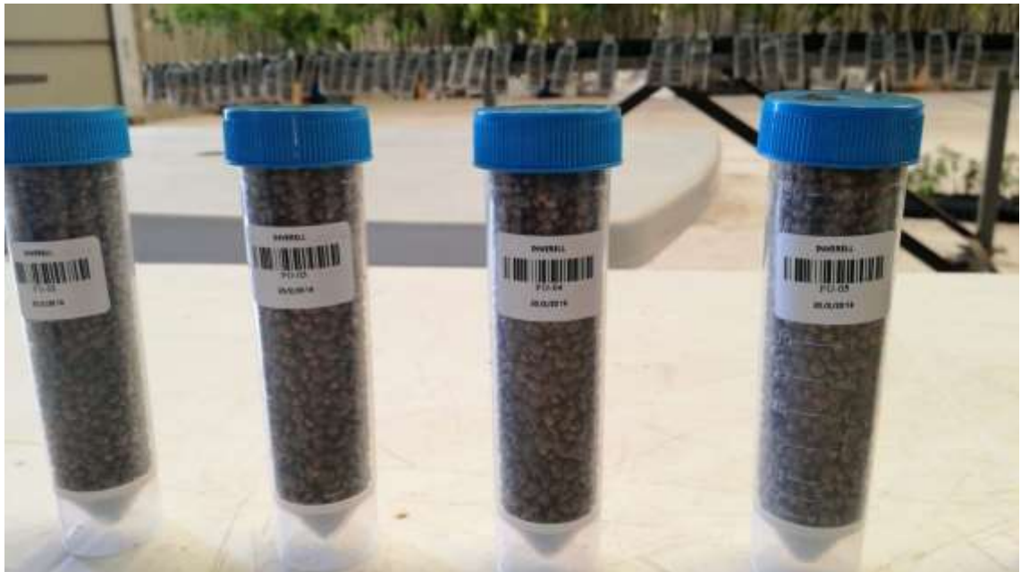
Figura 11. Semillas de Cannabis medicinal seleccionada y clasificada.