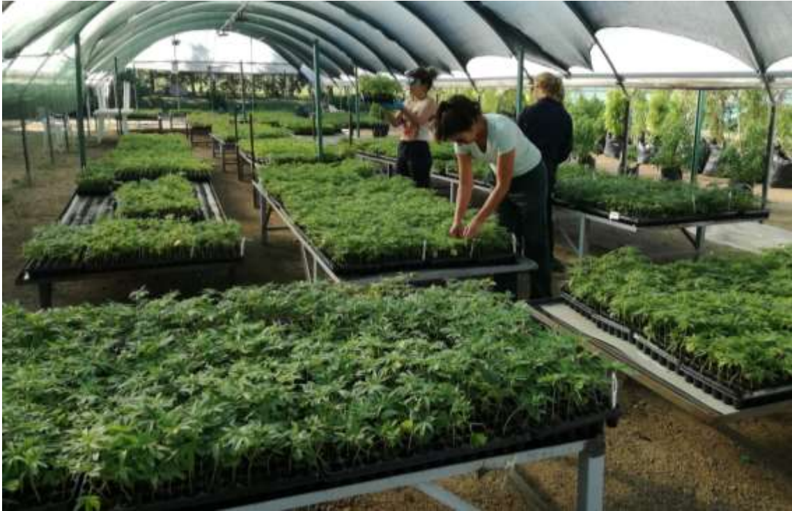
Figura 7. Vivero de esquejes de propagación clonal