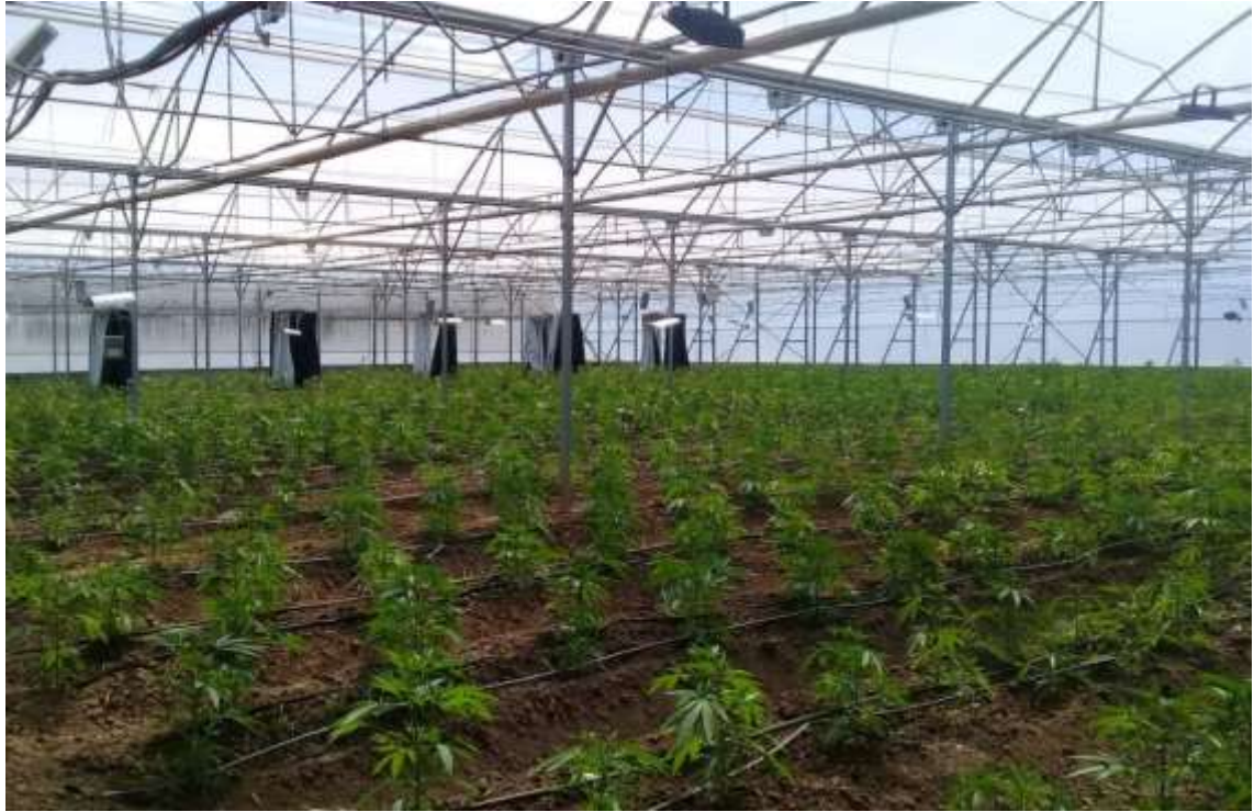
Figura 10. Plantación de Cannabis en invernadero para producción de semillas.