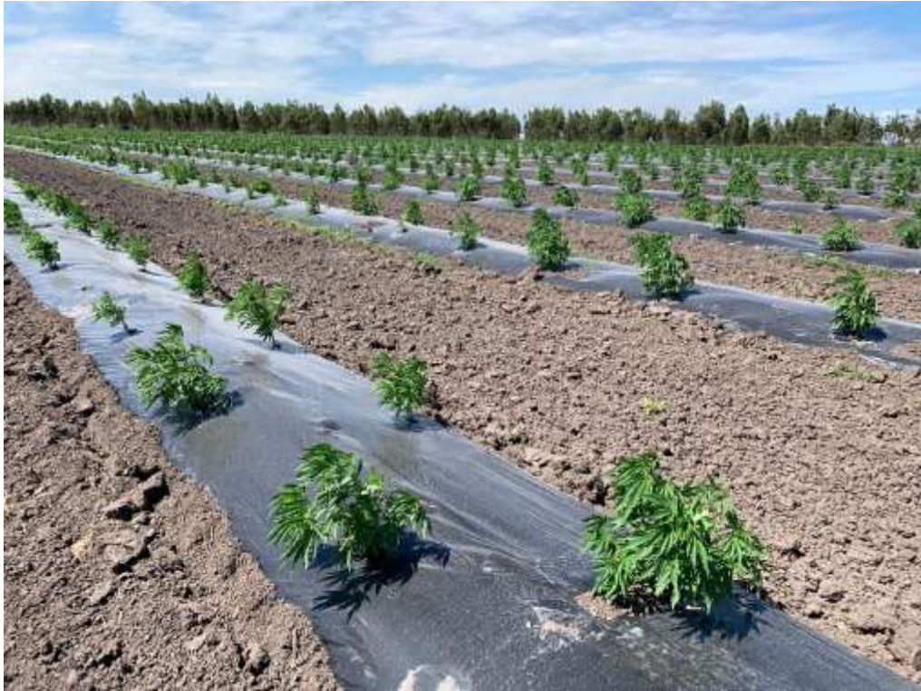
Figura 4. Plantación de Cannabis medicinal en Uruguay a tres semanas del trasplante y a partir de semilla feminizada.