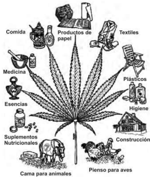
Figura 3. Principales productos obtenidos a partir de Cannabis sativa L. (Fassio, Rodríguez, & Ceretta, 2013)