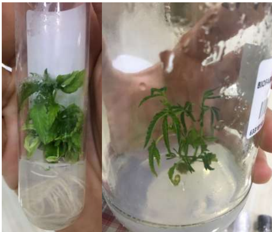
Figura 9. Plántulas de cannabis medicinal in vitro.