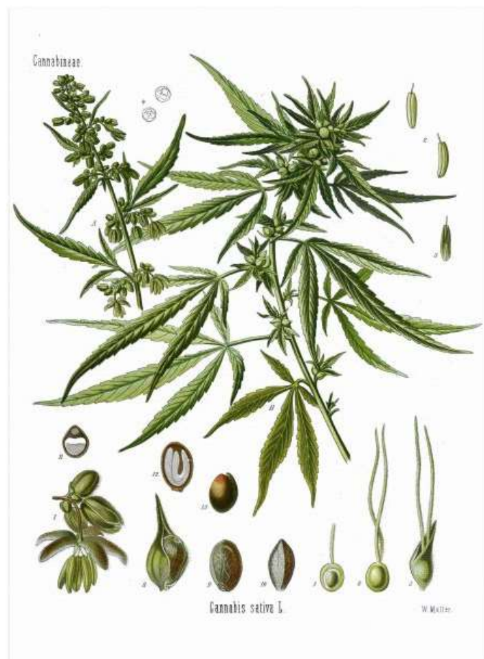
Figura 1. Cannabis sativa L. Köhler's Medizinal-Pflanzen. (Szulakowska & Milnerowicz, 2011)

Normalmente, el cannabis se manifiesta como una planta dioica (Figura 1) y menos frecuentemente como una monoica. La mayoría de variedades florece en días cortos (fotoperiodo menor a 12 horas) y continúa el crecimiento vegetativo en fotoperiodos más largos. El sexo es determinado por cromosomas heteromórficos y se pueden distinguir las flores masculinas de las femeninas por las diferencias morfológicas. En la fase vegetativa se dificulta la diferenciación de los individuos a causa de las similitudes morfológicas, sin embargo, con técnicas moleculares se puede hacer una identificación en etapas tempranas. (Thomas y ElSohly, 2016)