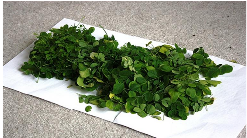
Figura 6: Cosecha hojas: Arriba, lista para cosecha, Der. 30 días luego de cosecha Abajo Izq. 43 días luego de cosecha, der, Hojas