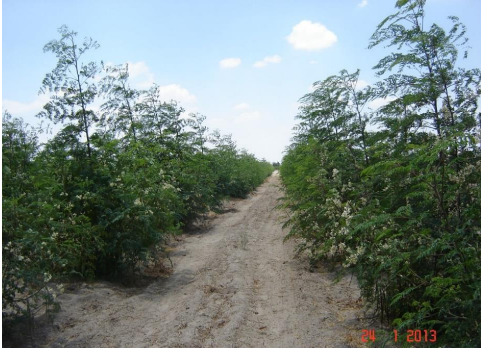
Figura 5: Campo para producción de semilla