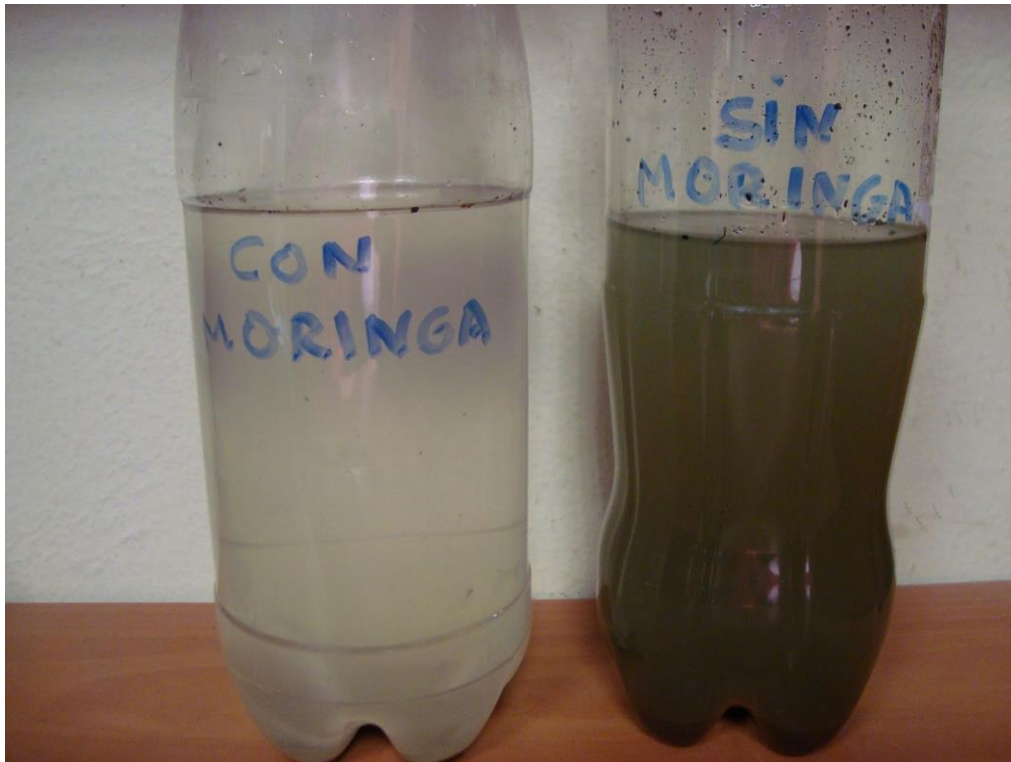
Figura 3: Uso de semilla molida como aclarante. (Botella de la derecha agua con turbidez, a la izquierda agua luego de la aplicación de semillas de moringa).

Por otro lado, se han hecho pruebas en Perú utilizando la torta molida para la purificación de agua, obteniendo resultados similares al usar semillas molidas manualmente.