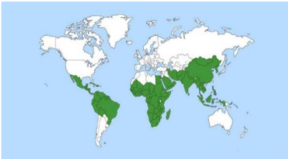
Figura 1: Países donde se cultiva moringa.

La moringa, se cultiva en todo el trópico y sub-trópico (Figura 1). Esta especie se desarrolla mejor en temperaturas de 25-35°C; es bastante tolerante a la sequía pero crece mejor con precipitaciones anuales de 250-1500 mm, prefiere altitudes por debajo de los 600 m pero puede sobrevivir a 1200 m (Parrotta, 1993).