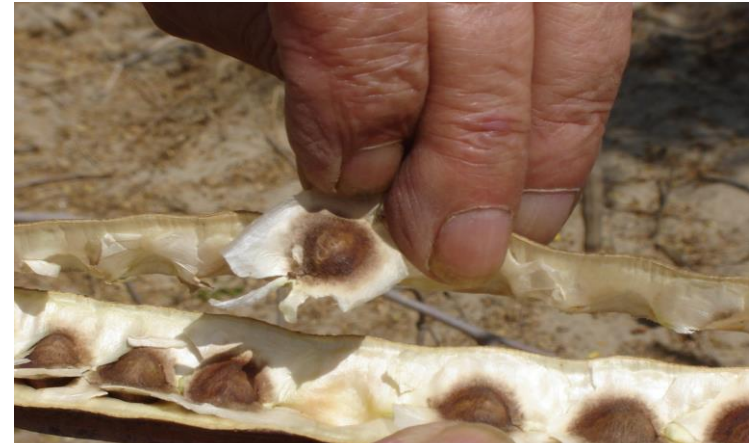
Figura 7: Cosecha de semillas: Arriba, Izq. Árbol en floración, Der. Vainas; Abajo Izq. frutos, Der. Semillas