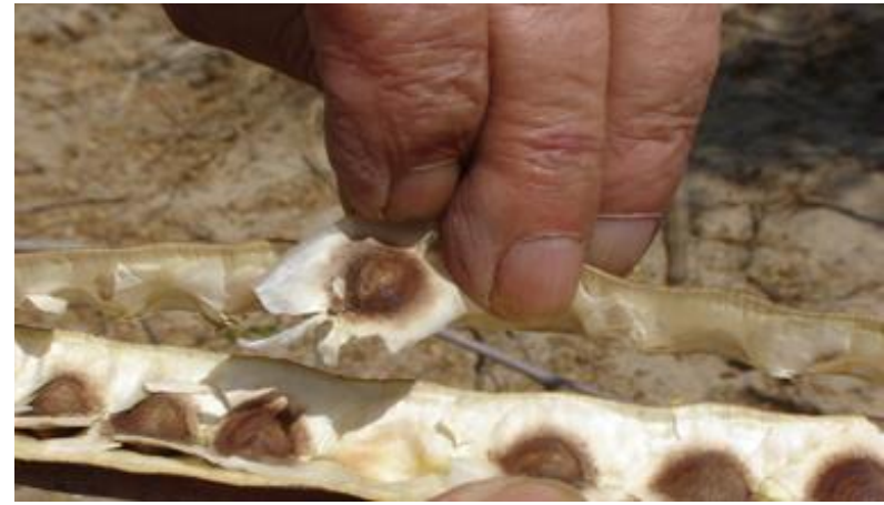
Figura 2: Morfología de la planta de moringa: Arriba, Izq. hojas tripinnadas, Der. Flores; Abajo Izq. frutos, Der. Semillas