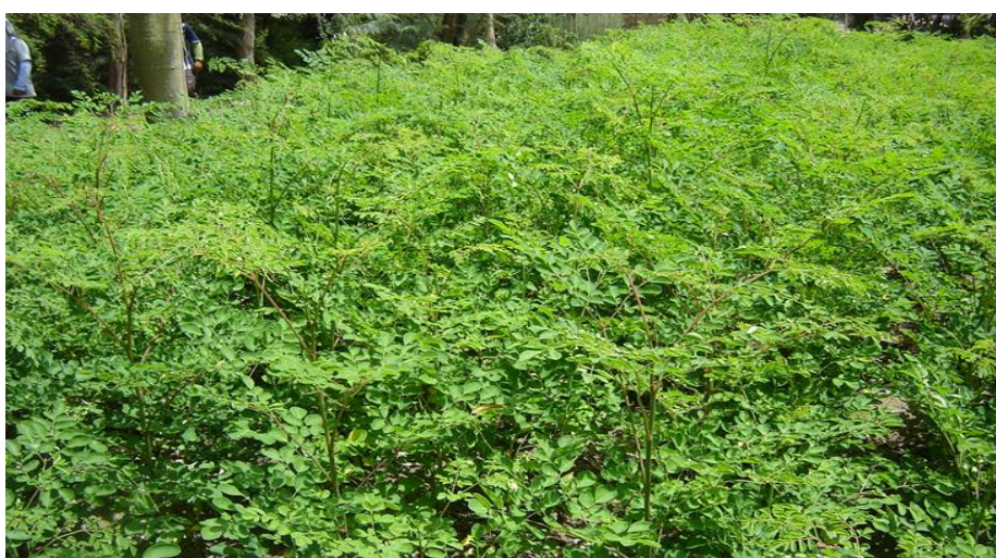
Figura 4: Campo para producción de hojas

Para el caso de producción de follaje o biomasa (Figura 4 y 5) la siembra se realiza cada 10 x 10 cm. Teniendo una población de un millón plantas por hectárea.